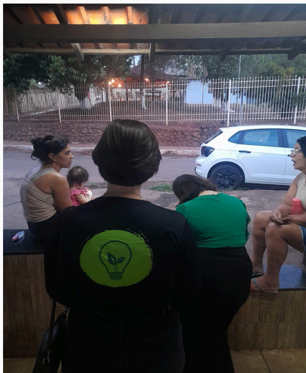
Figura 01: Inscrições presencial